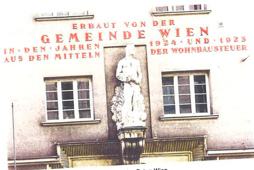
Abb. 2 Schriftzug auf Gall-Hof, Wohnbau des Roten Wien.

noch vielfach lesbar ist, allerdings aus Gewohnheit kaum mehr wahrgenommen wird. Der Wiener Schriftzug beschreibt ein Erbe von vor rund 100 Jahren: «Erbaut von der Gemeinde Wien in den Jahren 1924 und 1925 aus den Mitteln der Wohnbausteuer» steht heute noch in roten Buchstaben auf den Fassaden des Gall-Hofs sowie auch bis heute auf beinahe allen weiteren Gemeindebauten der Ära des Roten Wien (1919–1934).