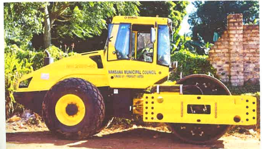
Abb. 1 «Funded by: Property rates»/«Finanziert durch die Grundsteuer» als Inschrift auf dem Infrastruktur-Fahrzeug der Stadt Nansana in Uganda.

Denn diese auf einem Fahrzeug der städtischen Verwaltung gut sichtbare Vermittlung des Zwecks, zu dem eine Steuer eingesetzt wird, erinnert frappant an einen historischen Schriftzug, der im öffentlichen Raum der Stadt Wien