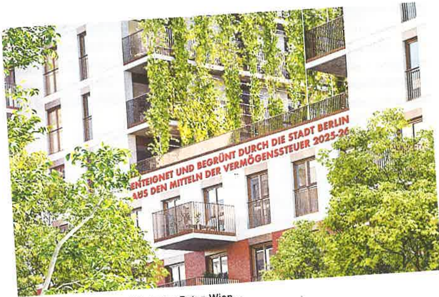
Abb. 3 Schriftzug inspiriert vom Roten Wien.

halten sie, gerade in unseren gegenwärtigen «alternativlosen» TINA (There is no alternative)-Verhältnissen, fest, dass es auch heute und in Zukunft anders sein kann. Das «Erbaut von der Gemeinde Wien» verweist auf das Konzept von Kommunalität. Der Hinweis auf die Wohnbausteuer steht als eine Errungenschaft, als etwas Durchgesetztes, er steht als ein Sieg in einem politischen Konflikt bis heute groß im Raum. Das lässt sich reaktivieren und re-artikulieren im Kontext heutiger umverteilungspolitischer Konflikt-Ziel-Setzungen, in Sachen Steuern, neue Organisationsformen und vieles mehr. Eine solche Re-artikulation stellt die Forderung der Initiative Deutsche Wohnen Enteignen in Berlin dar: nämlich nicht nur finanzialisierten Wohnraum zu vergesellschaften, sondern diesen in die Organisationsform einer Agentur öffentlichen Rechts zu überführen, also die Verwaltung des vorgesehen vergesellschafteten Wohnraums als genuin öffentliche Aufgabe zu reaktivieren.