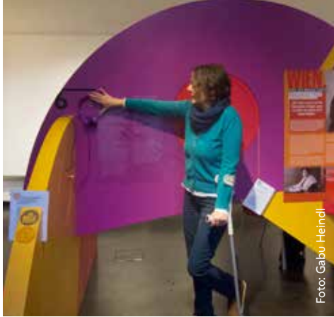
Workshop-Teilnehmerin erkunden Ausstellungsobjekte