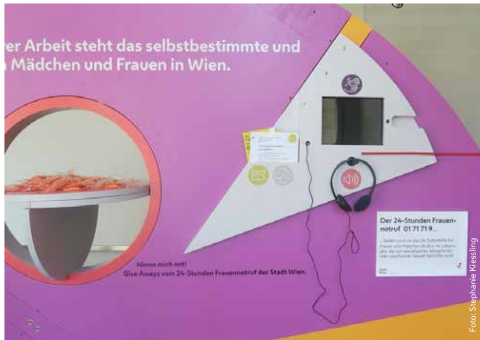
Detail Ausstellungsobjekt (Kippplatte und Multisensorium)

das Modell als auch durch eine Erklärung in verschiedenen Sprachen, in leicht verständlicher Sprache, in Brailleschrift und durch eine Audiostation. Ein Bodenleitsystem führt Blinde an die weiteren Ausstellungsmodule heran, auf den Modulen führt ein taktiler Streifen ihre Hand von Kapitel zu Kapitel. Ecken und Kanten ermöglichen es, den Blindenstock stationsweise abzustellen, die Hocker zum Sitzen lassen sich per Lasche leicht verschieben.